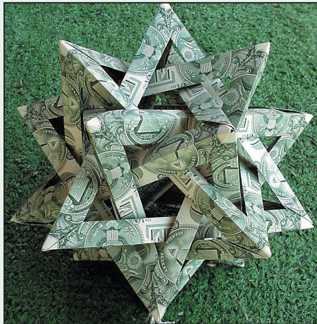
Model designed by Thomas Hull (Merrimack College) and Francis Ow, folded by PapaJoe (Joe Gilardi)

더 알아보기: http://db.uwaterloo.ca/~eddemain/papers/MapFolding/ Translation courtesy of volunteer members of the Korean Mathematical Society.